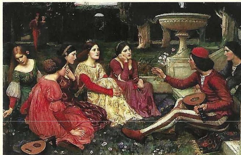
John William Waterhouse