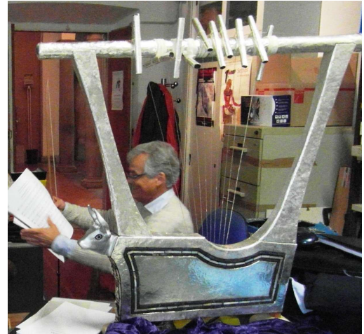
La lira d'argento di Ur, ricostruzione realizzata dall'iniziativa The Lyre of Ur Project , Lincoln (RU) in collaborazione con l'Istituto Lorenzo de' Medici, Firenze.

Anche nell'antica Grecia la denominazione dei suoni si riferiva alle corde della lira, dal suono più acuto della corda esterna, in senso discendente verso la corda più vicina al corpo del suonatore. La direzione della scala era quindi opposta a quella dell'arpa moderna e, se il suonatore inclinava lo strumento, la corda del suono